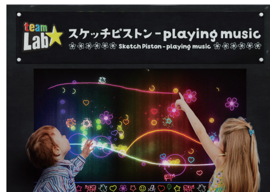
チームラボ《スケッチピストン - Playing Music》© チームラボ

待合室に設置できるモニター作品《スケッチピストン - Playing Music》と《こびとが住まう黒板》をチームラボの協力のもと提供して おります。待合室が自由なクリエイティビティを高める「共創の場」に。《ス ケッチピストン - Playing Music》、《こびとが住まう黒板》は、遊びの 中で、他者と共に、世界を創造していきます。ゲームをクリアするよう な明確なゴールはありません。ゴールすらも自分たちでみつけ、遊び方 を自分たちで創造しながら、そこに居る人たちが共に創り上げていきます。 タッチパネルを壁に設置するだけで、創造的な遊びの場が創出され、 楽しみながら過ごすことのできる場をつくることができます。