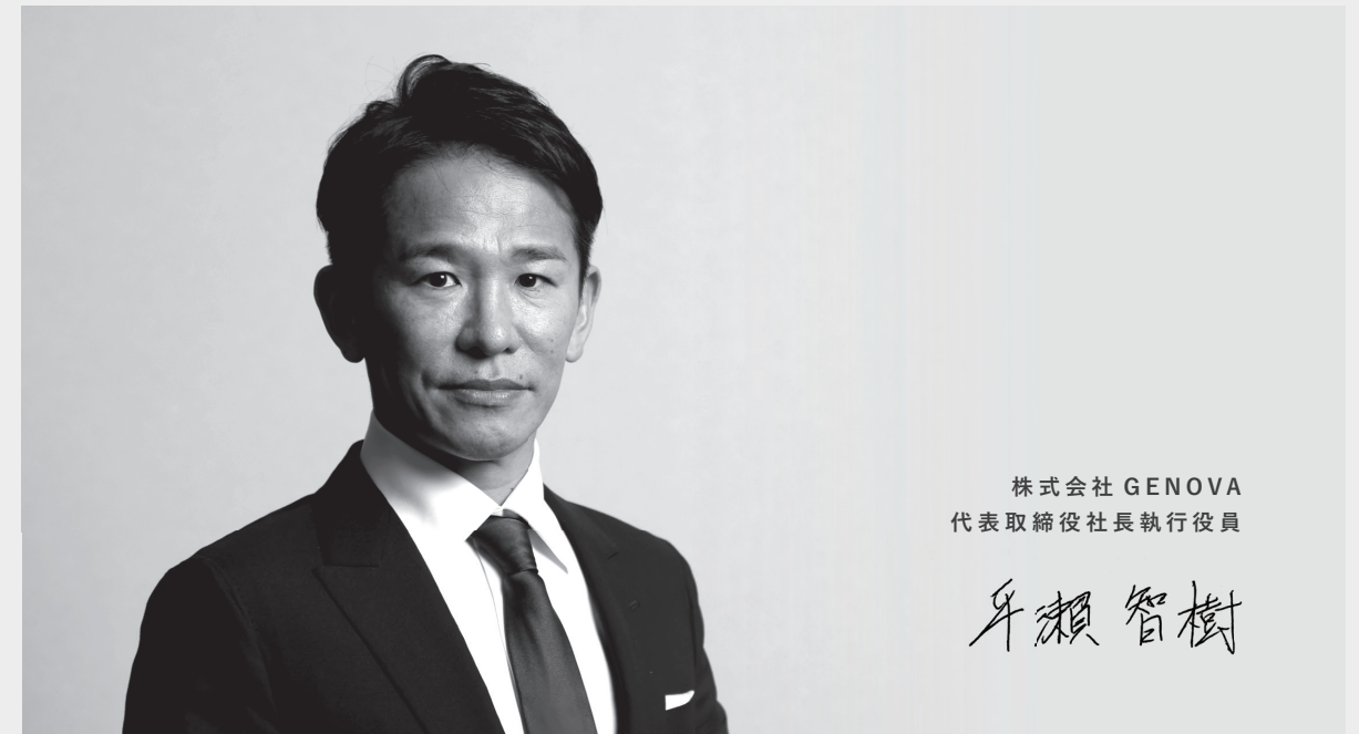
株式会社 GENOVA 代表取締役社長執行役員